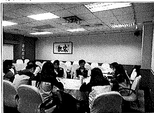
說明遲到輔導會議目的