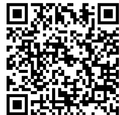
報名 QR CODE

中原大學服務學習粉絲團 https://www.facebook.com/CYCUSL